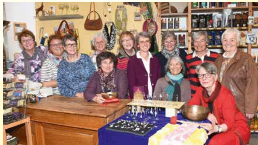
Das ehrenamtliche Team des Eine Welt Ladens