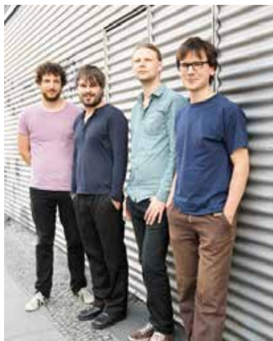
Songs der Band BLUME sind ein Abenteuer für Musiker wie Zuhörer.

Ein feingesponnenes, höchst expressives Klangnetz aus Jazz, neuer Musik und Pop-Avantgarde, geprägt von sinnbildlicher Lyrik und intensiven Stimmungen. Gold präsentiert ihr drittes Studioalbum „Echospheres“, das in Zusammenarbeit mit dem Polychrome