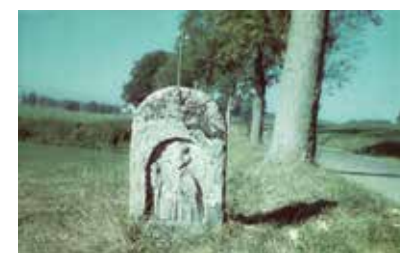
Der Burgfriedenstein an der noch unbebauten Scheyerer Straße in den frühen 50er-Jahren. Er stand wohl an der anderen Straßenseite (stadtauswärts links).

raums wurden auf kurfürstliche Initiative hin im Jahr 1689 zwölf Burgfriedensäulen aus Stein anstelle der vorher üblichen hölzernen Markierungen aufgestellt. Sie waren weniger anfällig gegen Witterungseinflüsse und nicht mehr der Gefahr willkürlicher Versetzung ausgesetzt, da sie bei einer Höhe von rund 1,50 Metern mehrere Zentner Gewicht besitzen. Die Burgfriedensteine verloren zu Beginn des 19. Jahrhunderts zwar ihre rechtliche Bedeutung, markieren aber bis heute die Ausdehnung der Stadt bis zur Gebietsreform 1971/72. pafunddu.de/11498