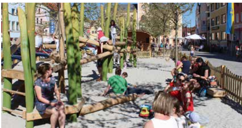
Das schöne Wetter, der Spielplatz und der Stadtstrand mitten auf dem Hauptplatz sowie die stets voll besetzte Bimmelbahn rundeten das Pfaffenhofener Sommermärchen 2017 ab.