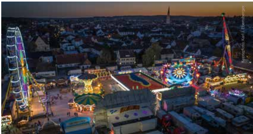
Das Volksfest 2017 wird den Pfaffenhofenern als sehr schön, aber auch ungewöhnlich in Erinnerung bleiben. Wegen der Gartenschau und der anschließenden Abbauarbeiten wurde es von Anfang September in den Oktober verschoben.