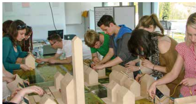
Schüler-Workshop an der Mittelschule mit dem BN-Energiespardorf

Die Stadt will auch 2018 Klimaschutz-Gutscheine vergeben. Informationen dazu sowie das Bewerbungsformular findet man auf der städtischen Internetseite www.pfaffenhofen.de/klimaschutzgutschein . pafunddu.de/11527