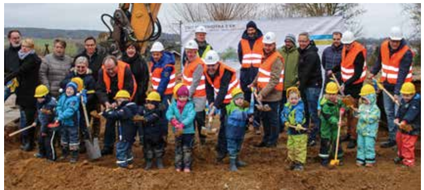
„Wer will fleißige Handwerker sehen?“ Mit einem Lied und dem ersten Spatenstich gaben die Kinder am 8. Dezember den Startschuss für den Neubau der Kita St. Andreas.