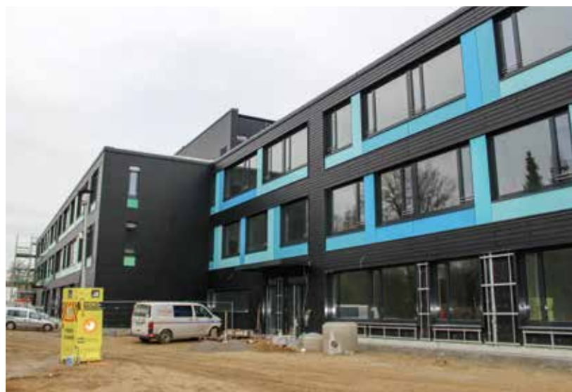
Die nach wie vor wichtigste Baustelle ist der Neubau der Grund- und Mittelschule am Kapellenweg, hier läuft derzeit der Innenausbau.