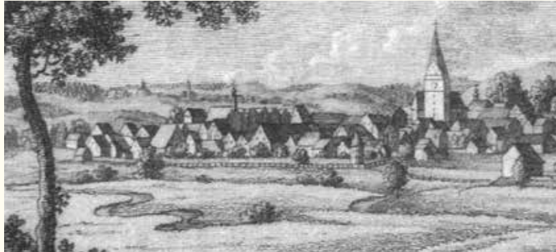
Ansicht der Stadt Pfaffenhofen von Nordosten mit der rechts im Vordergrund erkennbaren Arlmühle (Zeichnung von Laminit im National-Garde-Almanach 1815)

Neben dem Jahr 1918, das mit dem Ende des Ersten Weltkriegs, der Ablösung des Königreichs Bayern und dem Ende des Herrschergeschlechts der Wittelsbacher große Veränderungen brachte, erfolgten weitere 100 Jahre zuvor im Jahr 1818 Eingriffe, die dem damals zwölf Jahre jungen Königreich eine neue Verfassung brachten und es zudem in seiner inneren Struktur veränderten. Einige der damals beschlossenen Maßnahmen wirkten sich auch auf die Stadt Pfaffenhofen unmittelbar aus.