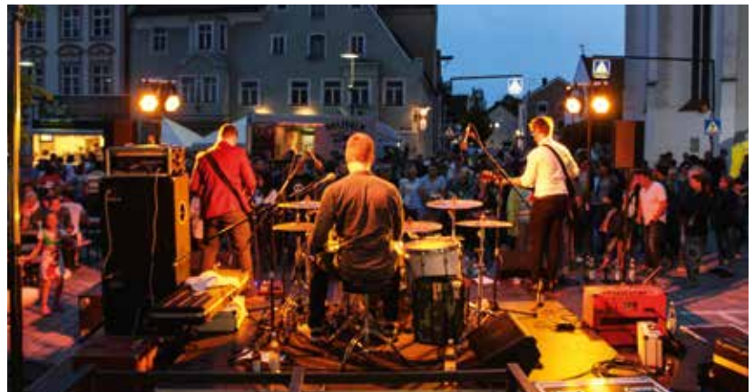
Es war ein großartiger Abend! Die Lange Nacht der Kunst und Musik lockte am 30. Juni rund 8.000 gut gelaunte Menschen in die Pfaffenhofener Innenstadt. Sie erlebten Kunst, Musik und ein buntes Unterhaltungsprogramm an allen Ecken.