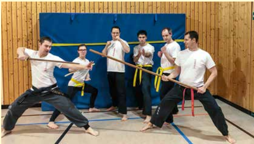
Kung Fu-Sportler des MTV bei der Vorbereitung zur anstehenden Gürtelprüfung

Seit 2011 sind die Kung Fu-Sportler der MTV-Karate-Abteilung angeschlossen. Aufgrund des Mitgliederzuwachses wollen sie nun eine eigene Abteilung gründen. Neue Trainingsstätte der Kung Fu-Sportler soll die Tischtennishalle am