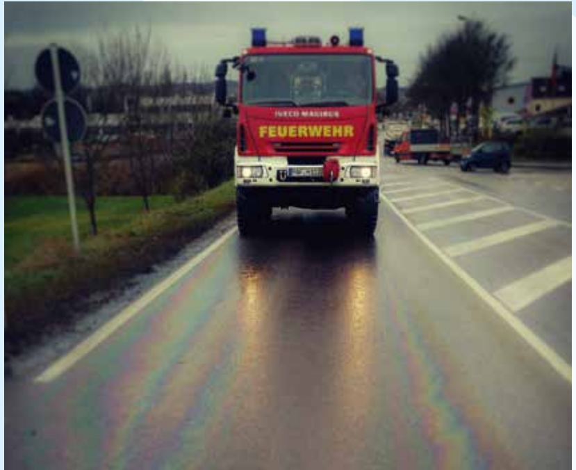
Einsatz Nr. 217 dieses Jahr: eine Ölspur am Ortsausgang Richtung Haimpertshofen

Zu insgesamt 14 Einsätzen rückten im November die Aktiven der Freiwilligen Feuerwehr Pfaffenhofen aus. Darunter waren u. a. Erstversorgungen von Personen bis zum Eintreffen des Rettungsdienstes sowie Wohnungs-