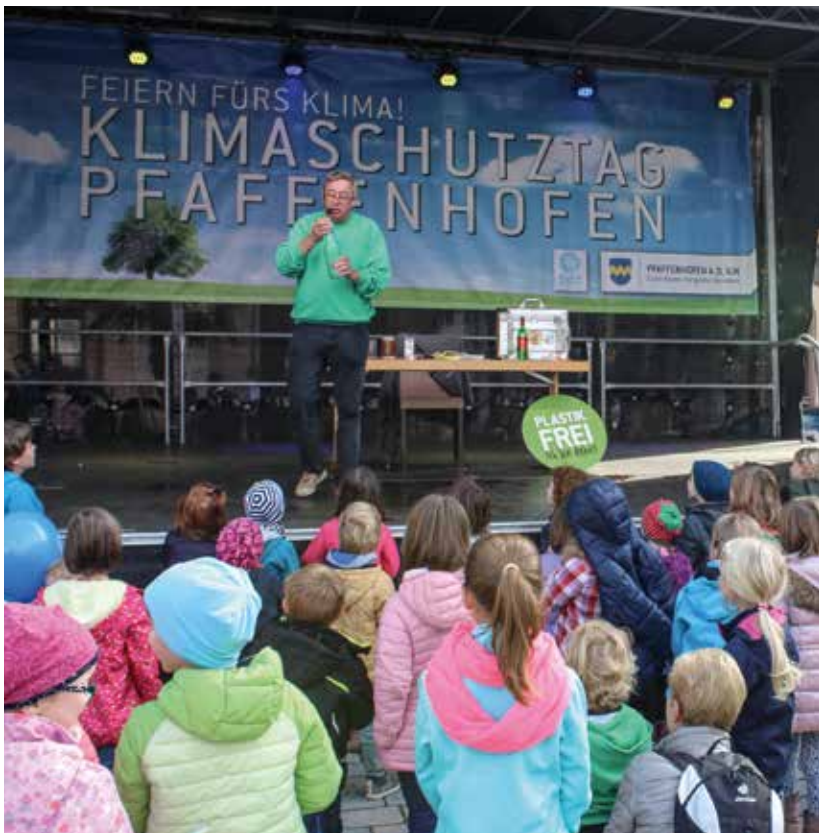
Nach dem Motto „Auf geht's, Welt retten!“ veranstaltete die Stadt Pfaffenhofen am 21. Oktober den dritten Klimaschutztag mit viel Information und buntem Programm, wie der Bühnen-Show von und mit TV-Star Christoph Biemann von der „Sendung mit der Maus“.