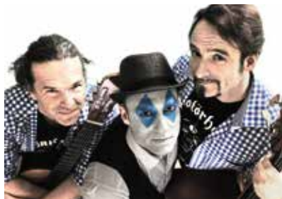
Das Kult-Musikkabarett Ciao Weiß-Blau gastiert am 3. März in Pfaffenhofen.

Ende Januar startet die Pfaffenhofener Winterbühne in ihre bereits sechste Saison. Wie gewohnt wartet auf das Publikum ein bunt gemischtes Programm. Mit dabei: Konzerte mit Weltmusik, Kabarettabende sowie auch Theateraufführungen und Live-Hörspiele speziell für Kinder. Für die insgesamt sechs Veranstaltungen reisen die Künstler nicht nur aus München und dem Umland an, sondern aus ganz Deutschland.