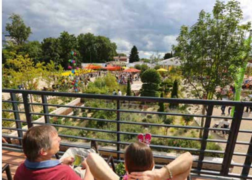
Die Gartenschau „Natur in Pfaffenhofen 2017“ bot u. a. am Festplatz schöne Aussichten.

5,8 Hektar dauerhafte Grünflächen und zentrale Parkanlagen sind entstanden, die jetzt jedem Bürger offen stehen und die zur Naherholung, zum Spazierengehen und Draußensitzen geradezu einladen. Hier bieten sich nun ganz neue Möglichkeiten: Grillplätze im Sport- und Freizeitpark, ein dauerhafter Biergarten im Bürgerpark,