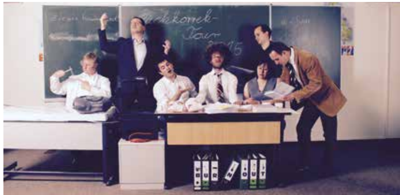
BurnOut – Die Lehrerband des Schyren-Gymnasiums

Die Intakt-Musikbühne hat zum Jahresanfang für jeden Geschmack etwas zu bieten. Los geht es am 14. Januar mit der 90-Minuten-Randale des Totalen Bamberger Cabarets (TBC) durch die Skandale und die große Politik. Ihr Jahresrückblick präsentiert, wer top war und wer flop, was ein Hit war und was Shit. Vom Best of 2017 bis zum Rest of 2017 wird geklatscht, getratscht und ordentlich abgewatscht.