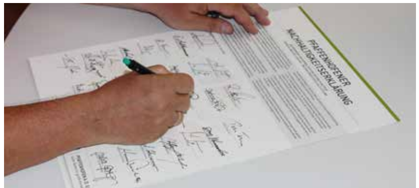
Die Bürgermeister und Stadträte haben im Juli nach einstimmigem Beschluss die Pfaffenhofener Nachhaltigkeitsklärung unterzeichnet. Sie wollen bei allen künftigen Entscheidungen berücksichtigen, ob diese im Sinne der UN-Nachhaltigkeitsziele sind.