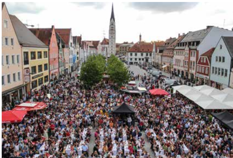
Richtig voll war es auf dem Hauptplatz bei den Open-Air-Konzerten im Kultursommer.

So trocken es auch klingen mag – die Neuaufstellung des Flächennutzungsplans (FNP) hat durchaus