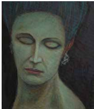
Georg Pamler: Gesicht in blau, 1987

Eröffnet werden die Ausstellungen in der Städtischen Galerie jeweils am Freitagabend vor Ausstellungsbeginn um 19.30 Uhr. Der Eintritt ist immer frei. pafunddu.de/10863,11322,11350