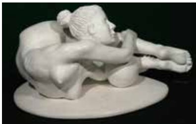
Diese Skulptur von Uwe Quade ist bei der Ausstellung des Kunstkreises zu sehen.

Mit dem Titel „In Bewegung“ präsentiert der Kunstkreis Pfaffenhofen vom 6. bis 21. Januar seine traditionelle Ausstellung zum Jahresanfang. Hier setzen sich die Mitglieder des Kunstkreises mit einem scheinbar ganz alltäglichen Thema auseinander: Bewegung bzw. in Bewegung sein. Ziel des Kunstkreises ist es, Bewegung einzufangen. Dadurch kommt diese kurzfristig zum Stillstand und wird erkennbar. Hier liegt die besondere Herausforderung, denn in einer Momentaufnahme soll die Dynamik der Bewegung für das Auge des Betrachters erhalten bleiben.